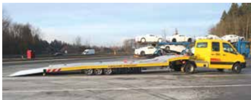
Ideal für zwei Fahrzeuge