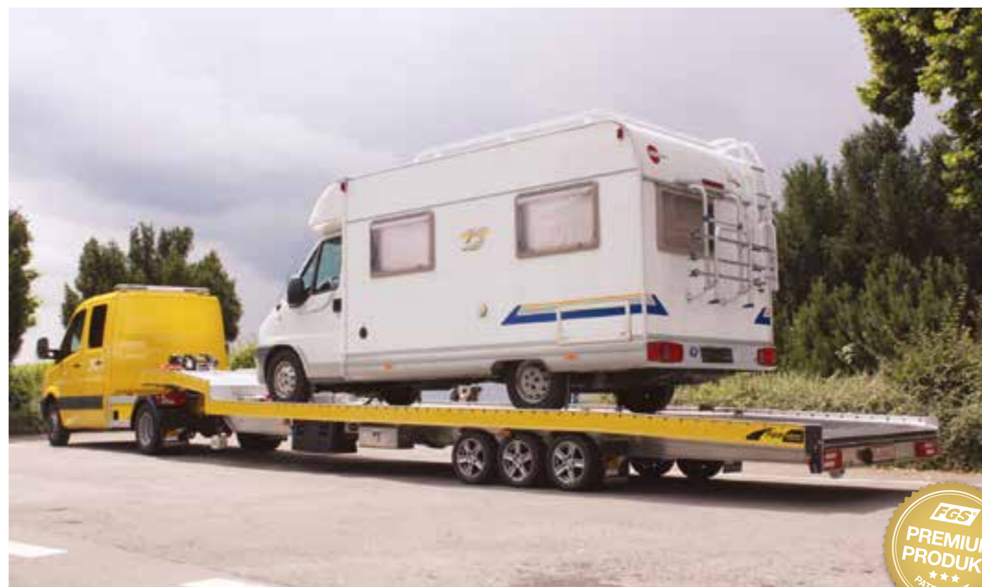
Der Max-Liner-Tridem in seinem Element