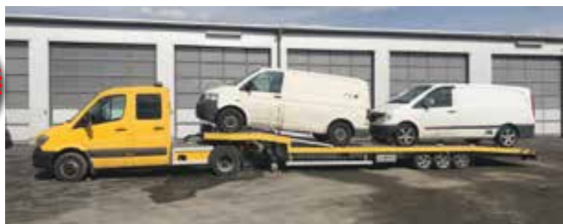
Extrem flache Auffahrverhältnisse