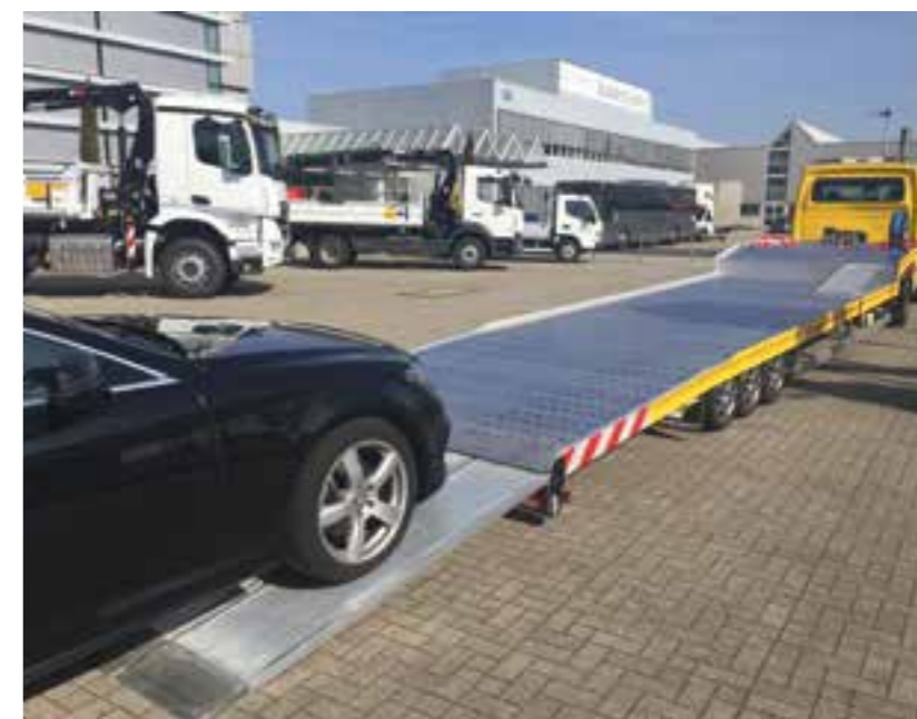
Trotz der beeindruckenden Größe ist das Be- und Entladen ein Kinderspiel