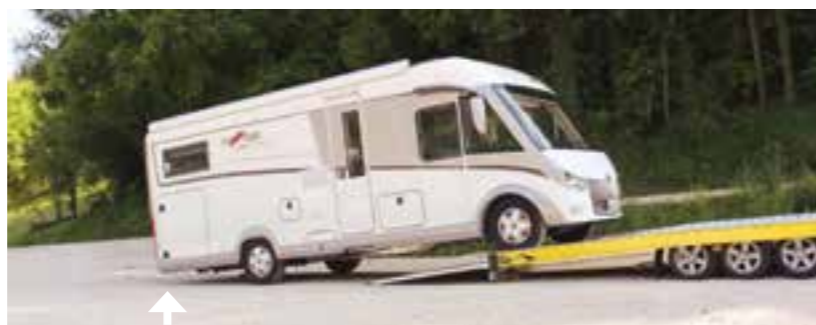
Bodenfreiheit durch die extrem flachen Auffahrverhältnisse