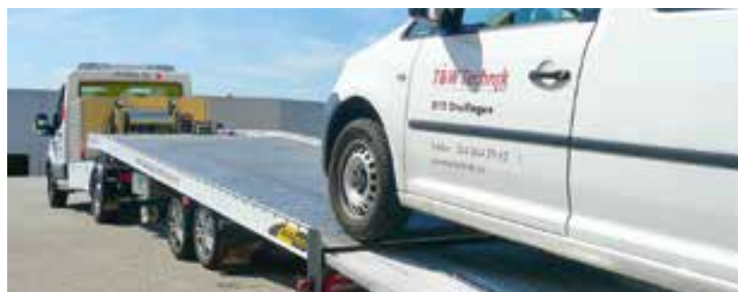
Sehr flache Auffahrverhältnisse