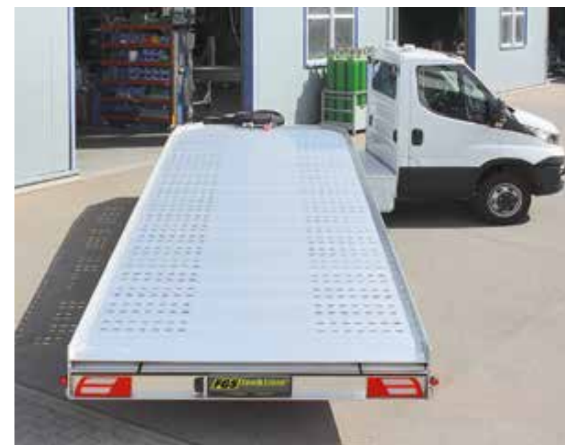
Kurz und wendig