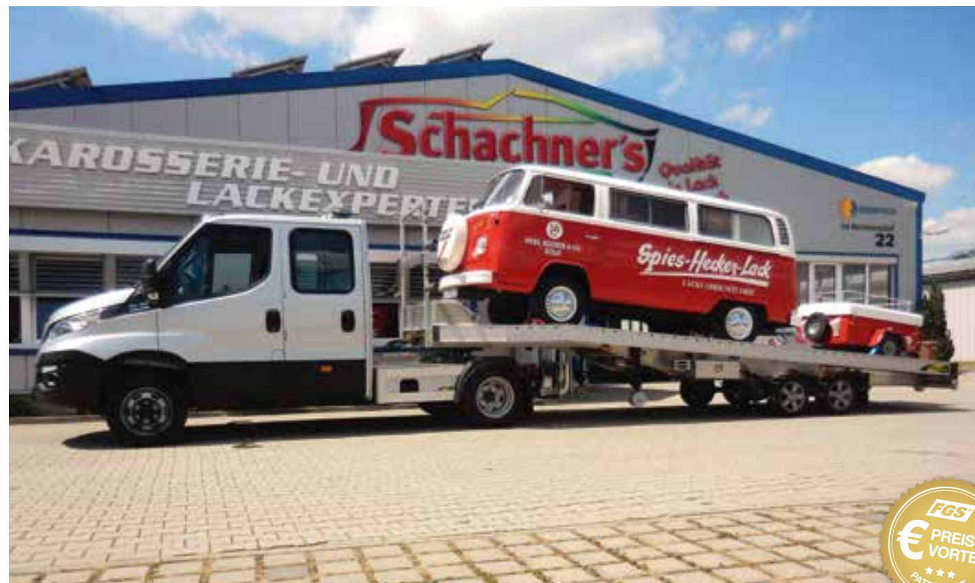
Sondertransporte: Kein Problem!