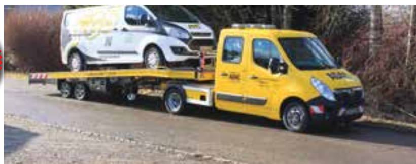
Bis zu 7 Insassen im Doppelkabinen-Zugfahrzeug