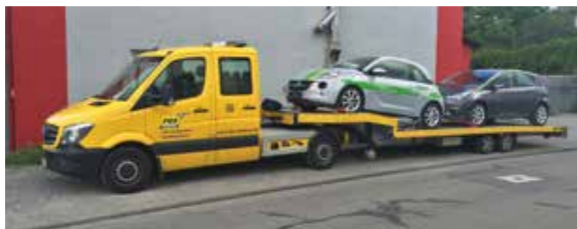
Ideal für zwei Fahrzeuge