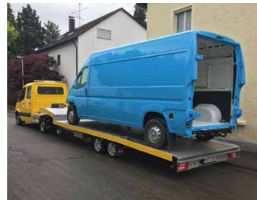
Transport auch von hohen Fahrzeugen durch die niedrige Bauweise