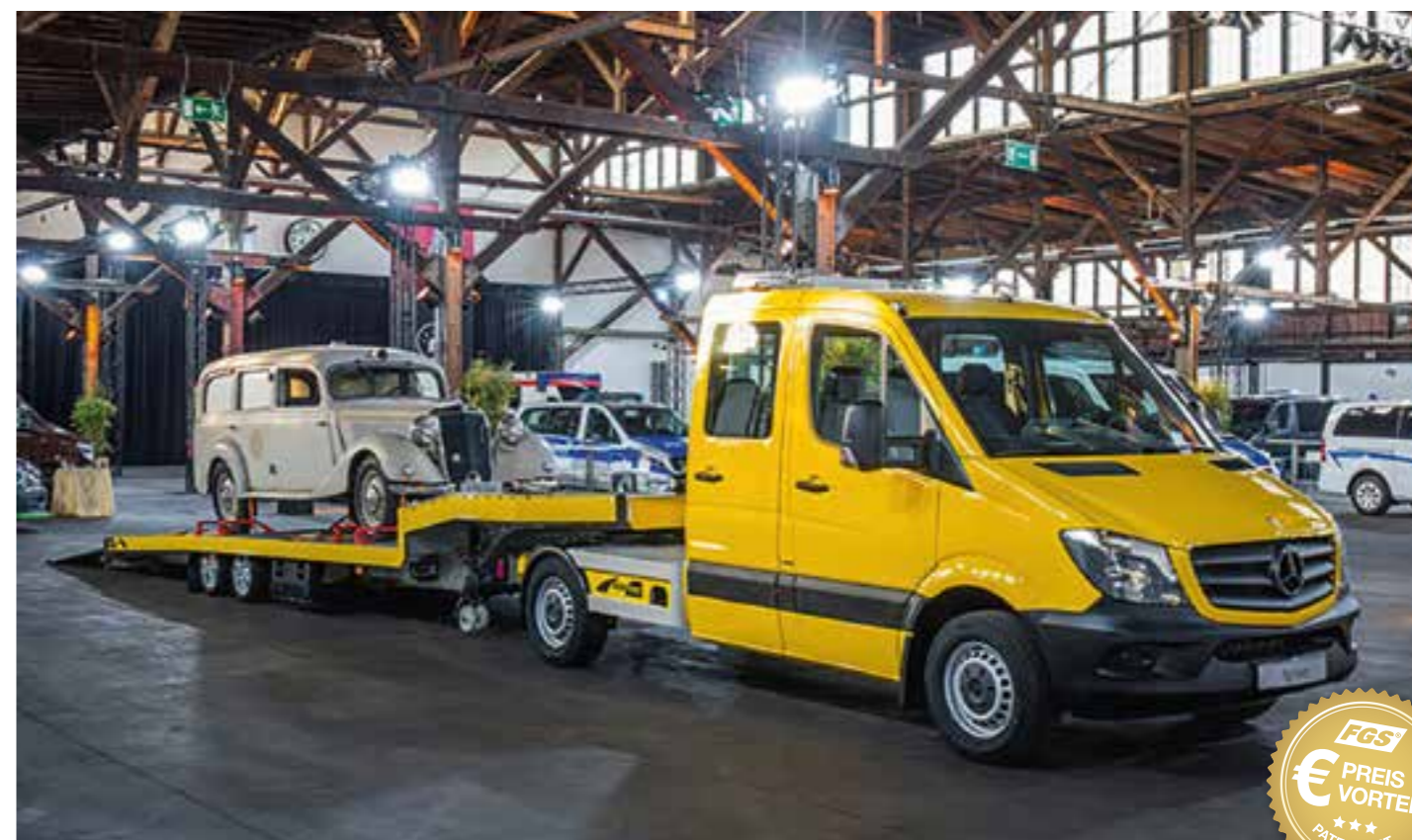
Im Rampenlicht: Der Tiefbett-Auflieger CLS