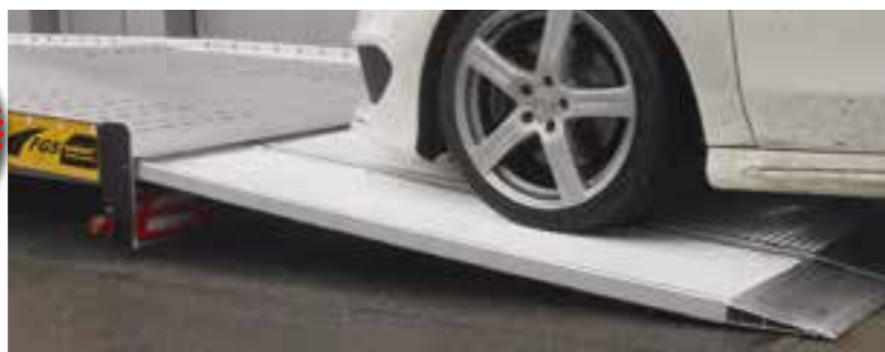
Extrem flache Auffahrverhältnisse