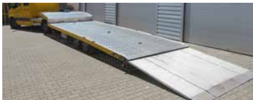
Geschlossene hydraulische Rampe