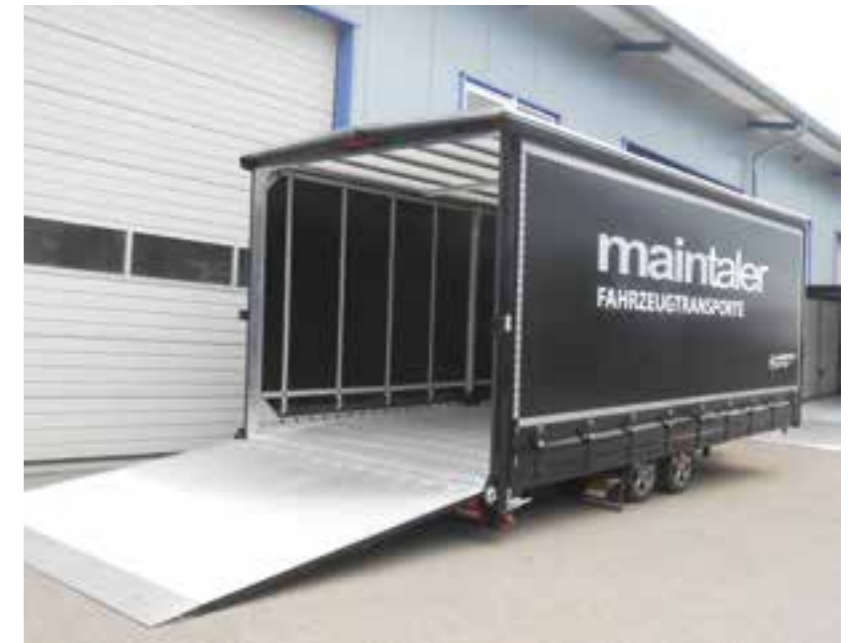
Auch mit mit Schiebep lane lieferbar