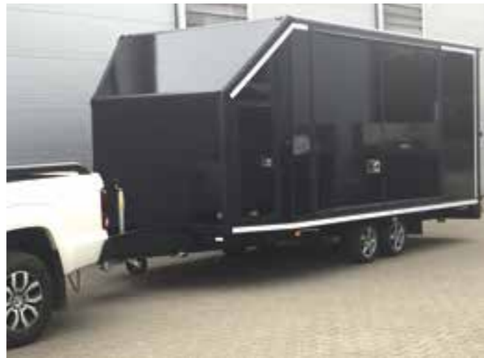
Aerodynamische Front – ideal auch hinter Geländewagen/ SUV