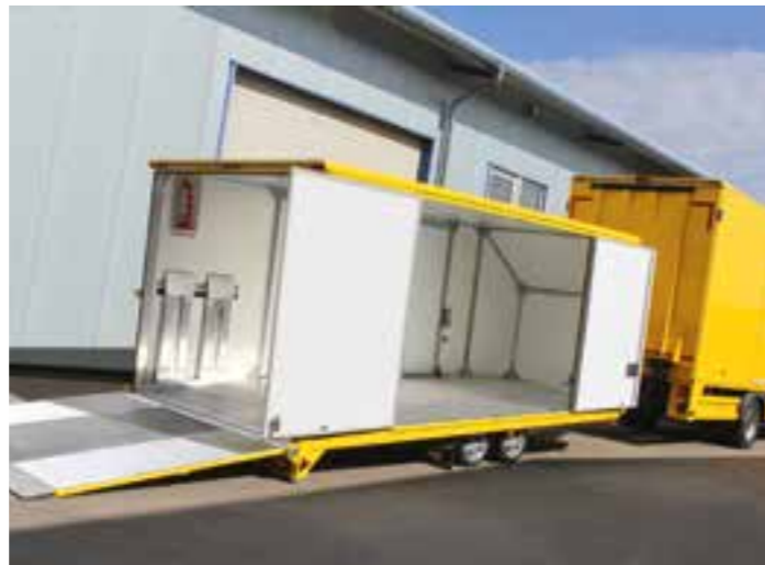
Der Aero in Zugkombination mit einem DSC-Doppelstock-LKW