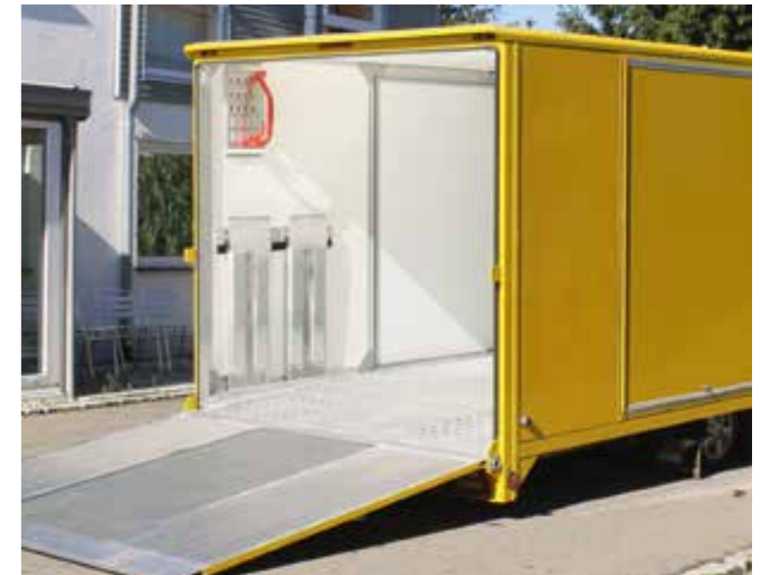
Äusserst flache Verladeverhältnisse durch die FGS-Absenktechnik