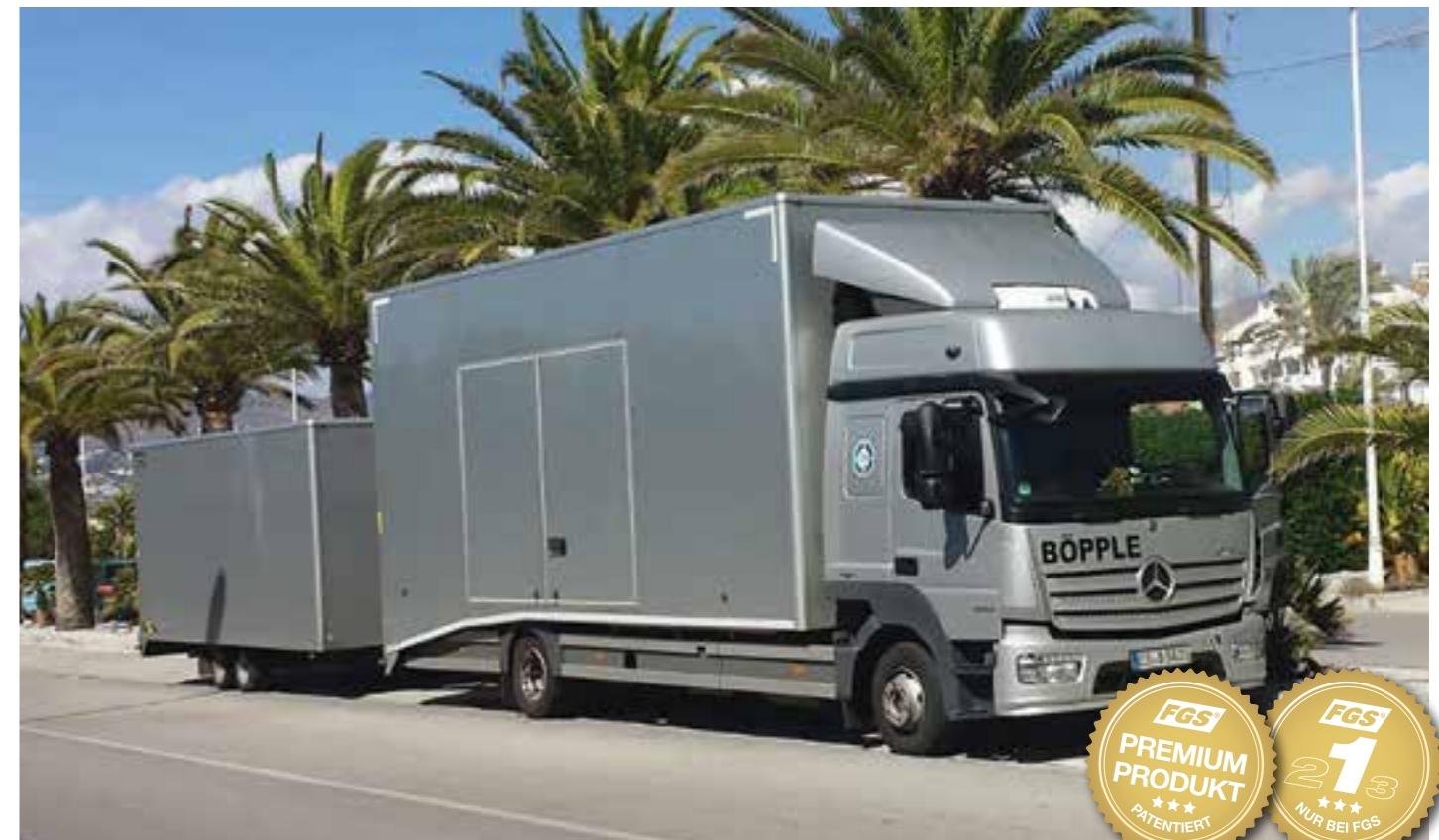
Ideal auch im Gesamtzug