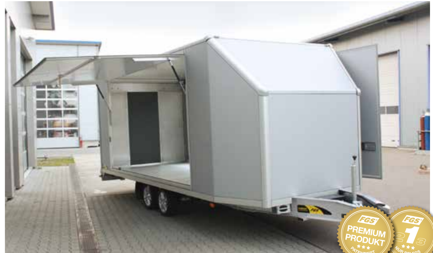
Kombiniert lieferbar mit seitlichen Türen und/oder Klappen