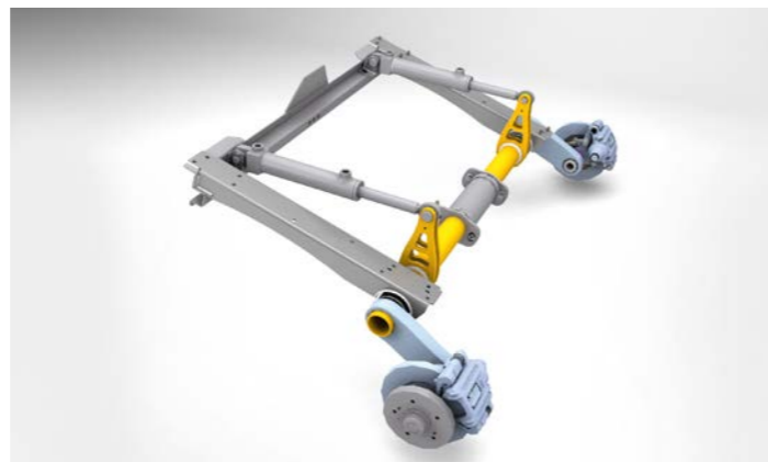
Die zum Patent angemeldete D-Liner-Achse mit hydro-pneumatischer Federung