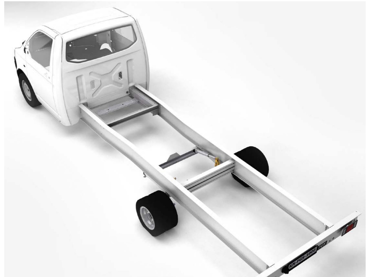
Extrem leichtes D-Liner-Chassis mit hydro-pneumatischer Federung