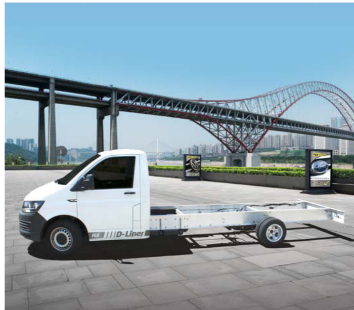
D-Liner-Chassis mit zwillingsbereifter Hinterachse

(Die Radstände außerhalb des VW T6 orientieren sich an den Originalradständen)