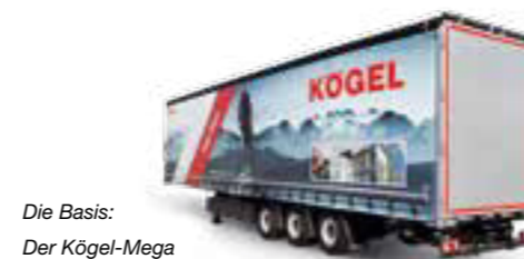
Die Basis: Der Kögel-Mega