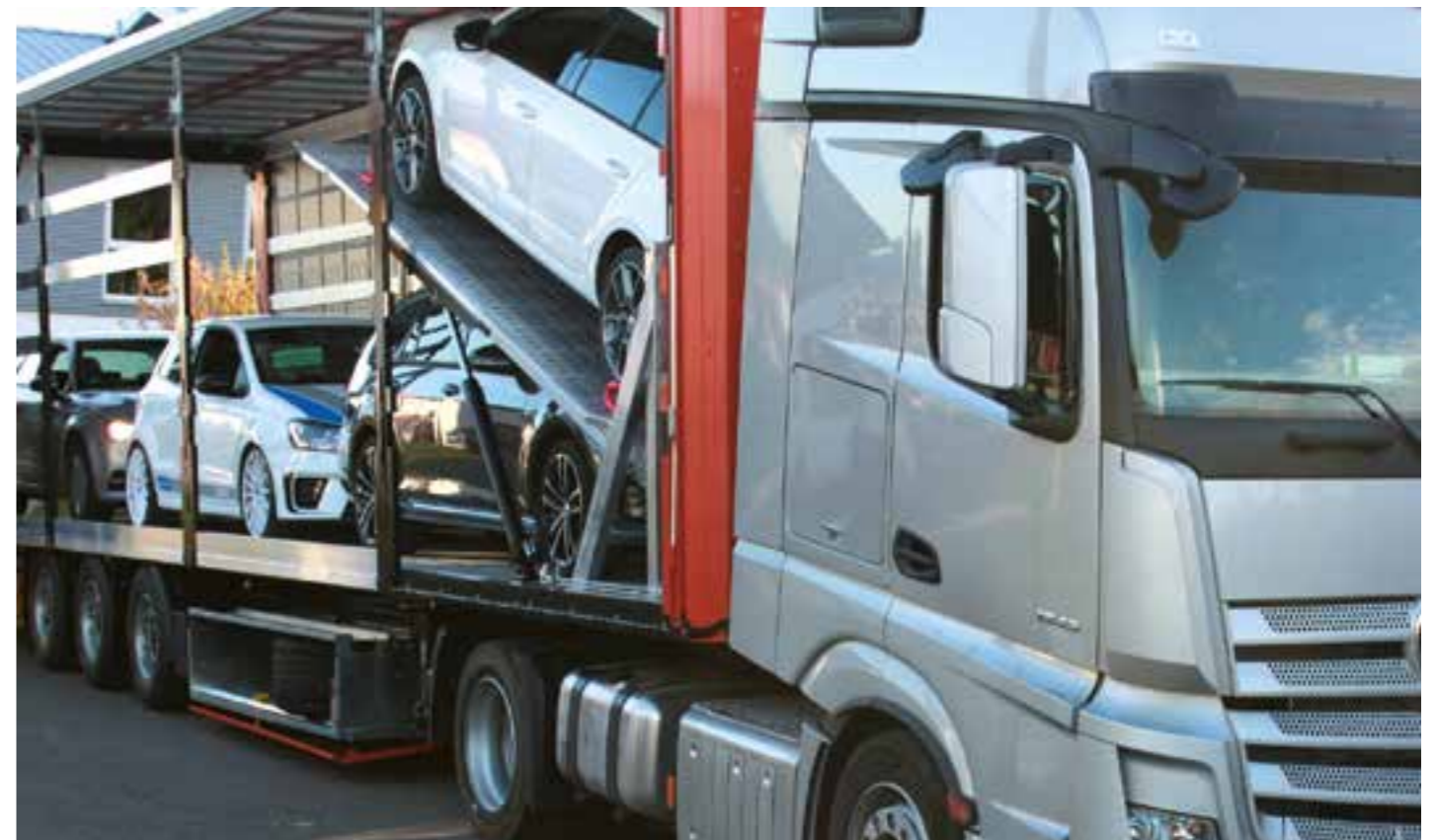
Flexibilität neu definiert: Bis zu 4 PKWs oder auch zwischendurch mal Stückgut – der Mega-Liner macht's.