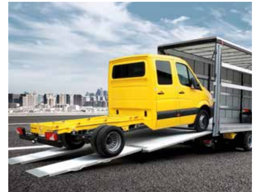
Transporter auch mit Hochdach: Kein Problem für den Mega-Liner