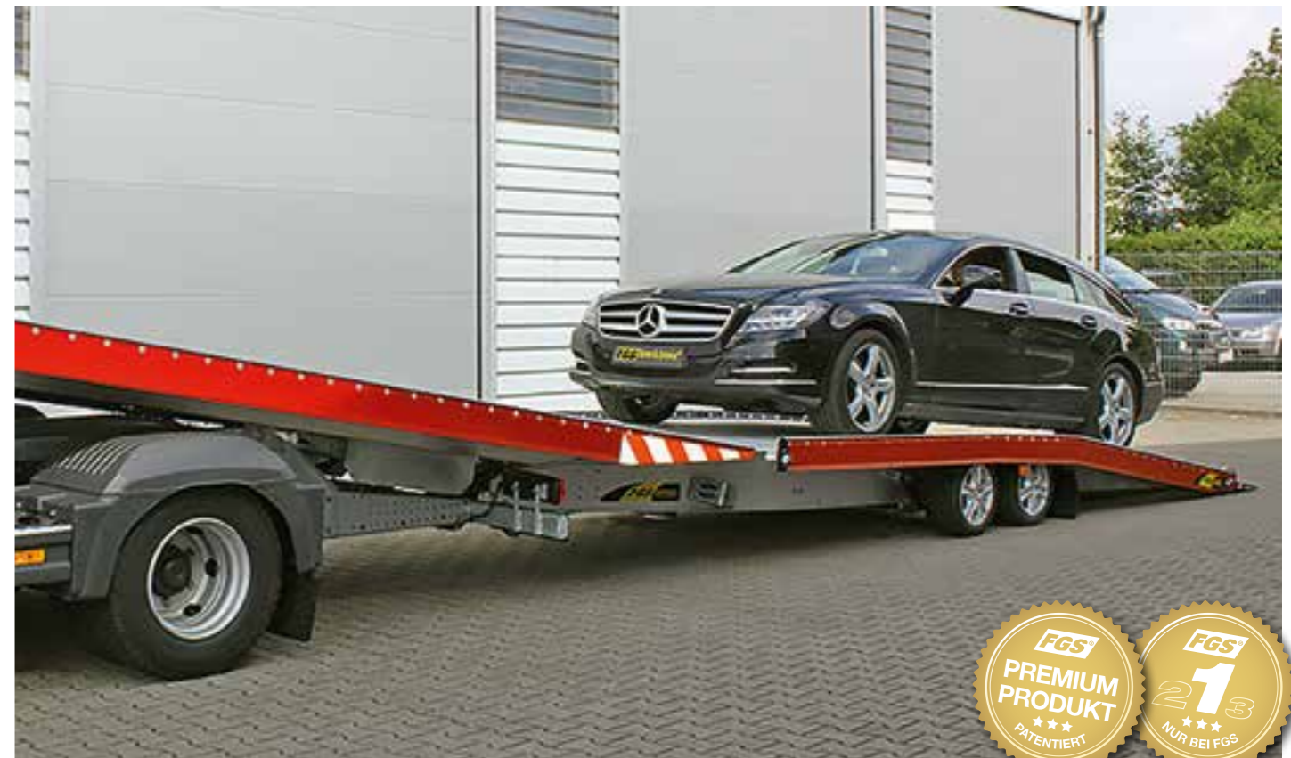
Ideales Überfahren auf Schiebeplateau