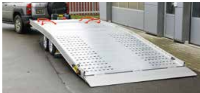
Schnelles Be- und Entladen